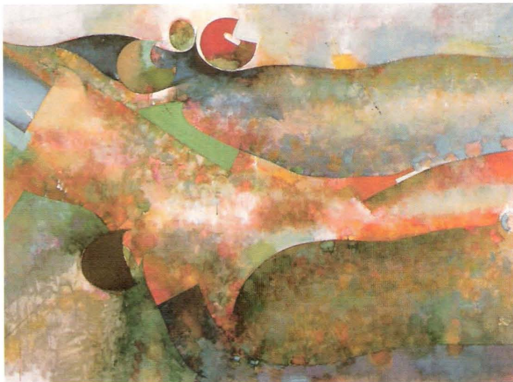
Dombok, 1985, olaj, vászon, 130 x 160 cm