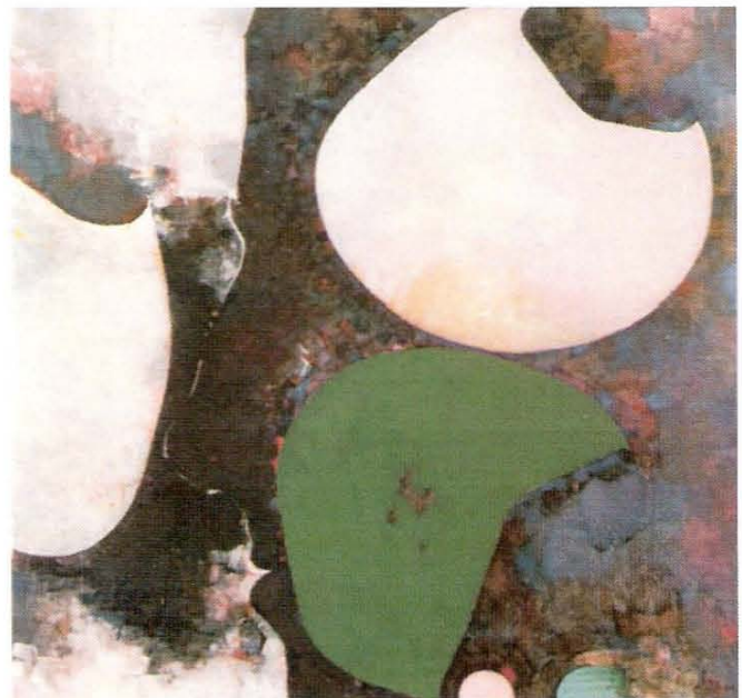
Emlékezés, 1988 olaj, vászon, 100 x 100 cm