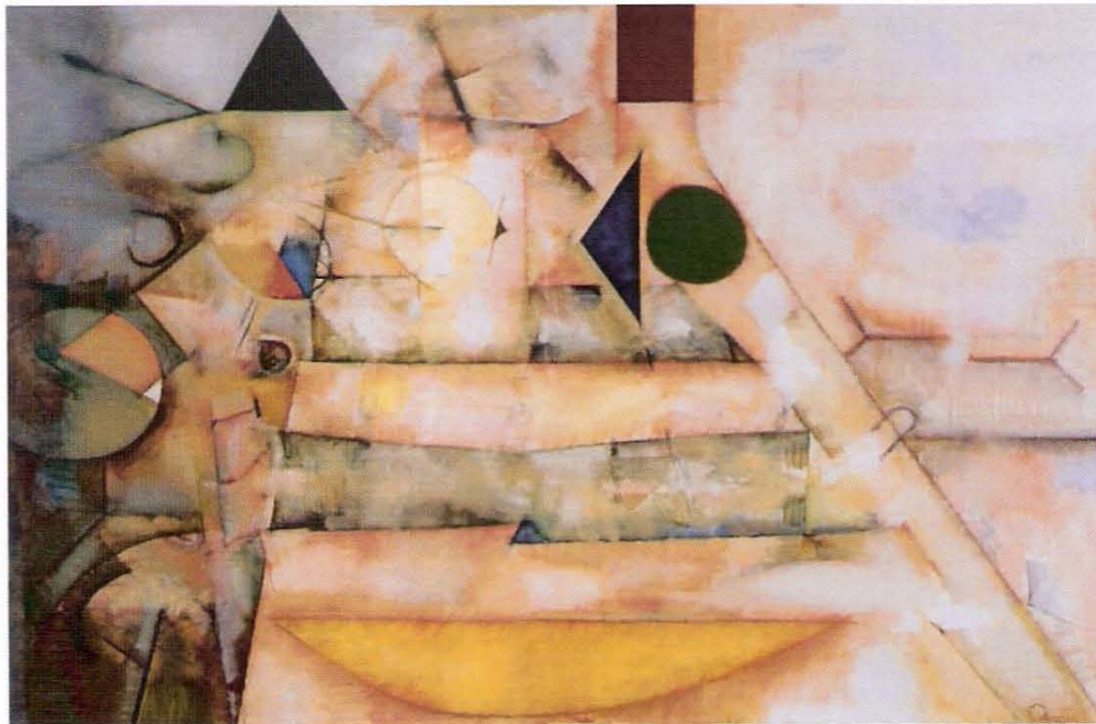
Várom, 1979, olaj, vászon, 114 x 162 cm