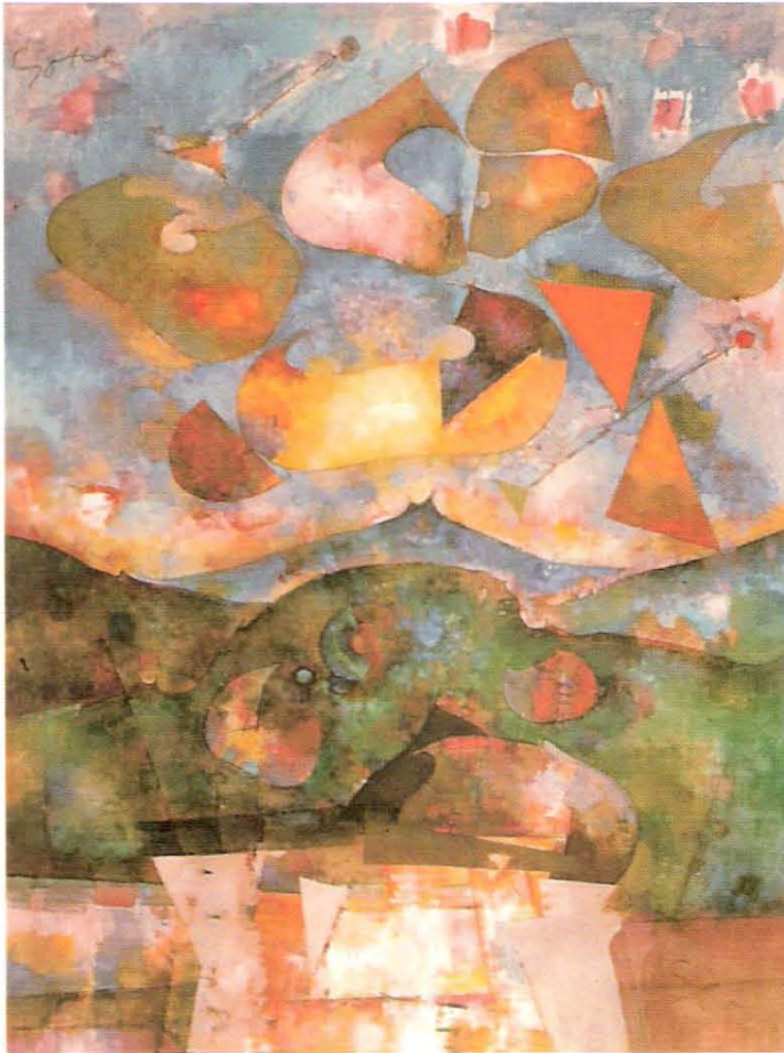
Hol vagy te Széphalom (Berzsenyi), 1995 olaj, vászon, 160 x 115 cm